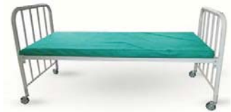
เตียงซิมมอนส์ Hospital Bed ขนาด 90 x 200 x 60 CM. รับน้ำหนักได้ ถึง 150 กิโลกรัม เตียงทำจากเหล็ก พ่นสี กันสนิม