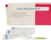
ชุดตรวจสอบสารเสพติดในปัสสาวะแบบจุ่ม (Bioline Methamphetamine Strip 100T) ใช้ตรวจสอบหาสารเสพติด “ยาบ้า, ยาไอซ์”