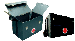
กระเป๋าปฐมพยาบาลสายสะพาย - ขนาด 12 x 6 x 8 นิ้ว - ขนาด 14 x 8.5 x 9.5 นิ้ว