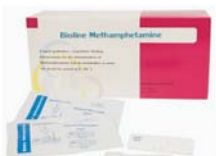
ชุดตรวจสอบสารเสพติดในปัสสาวะแบบตลับ (Bioline Methamphetamine Card 40T) ใช้ตรวจสอบหาสารเสพติด “ยาบ้า, ยาไอซ์”