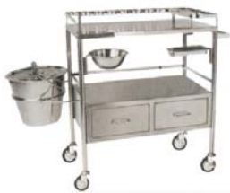
รถเข็นทำแผล + อ่าง + เเทร์ Dressing Cart ขนาด 45 x 73.5 x 80 CM. โครงทำด้วยสเตนเลส 2 ชั้น 2 ล้อชัก