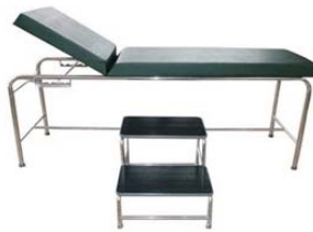
เตียงตรวจโรค Examine Bed ขนาด 60 x 185 x 80 CM. รับน้ำหนักได้ ถึง 100 กก. พร้อมบันได 2 ชั้น รุ่นสเตนเลส และรุ่นเหล็กพ่นสี