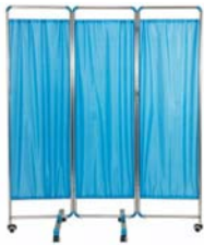
ฉากบังตา 3 ตอน Panel Screen ขนาด 200 x 165 CM. มี 2 รุ่น รุ่นสเตนเลส และรุ่นเหล็กพ่นสี